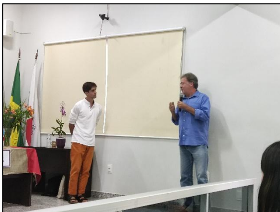
Fala de vereador parceiro do projeto.