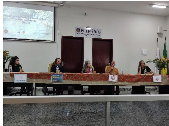
Fala dos proponentes do projeto.