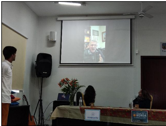
Vídeo enviado com fala da promotoria.