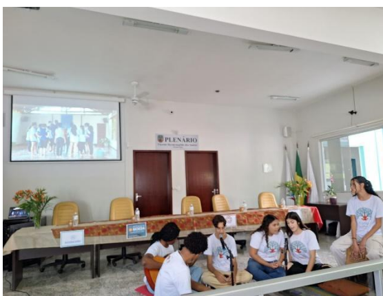
Apresentação musical dos estudantes. Autoria: Luísa Mosqueira Data: 13/07/2024

Após a apresentação musical, duas participantes foram convidadas para realizarem a “Saudação ao Sol”, que é uma prática da Yoga. Trata-se de uma sequência de doze posturas e que remete ao simbolismo do sol como a fonte de toda a vida, com os movimentos lembrando o nascer e o pôr do sol. Por meio da apresentação, foi possível observar o aprendizado adquirido pelos estudantes com as práticas de Yoga e meditação proporcionadas de forma transversal nas atividades do projeto.