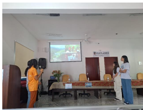
Apresentação das estudantes sobre o projeto. Autoria: Luísa Mosqueira Data: 13/07/2024

Com isso, os presentes prepararam o local para a exibição do documentário sobre o projeto, uma das programações mais aguardadas do evento. A produção, de aproximadamente 30 minutos, foi elaborada por meio de recursos municipais concedidos com a Lei Paulo Gustavo. Ao longo de diversas ações do projeto, a produtora audiovisual responsável captou imagens e relatos dos estudantes e equipe gestora. As falas apresentadas ressaltaram a importância da iniciativa, dos saberes adquiridos e o incentivo ao bem-viver, por meio da integração e equilíbrio do ser humano e a natureza. A produção pode ser assistida no YouTube, no seguinte link: https://youtu.be/uGAbuZ7d7_k?si=kYWIAIW7VgQBJrRz .