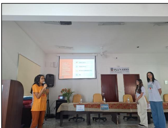
Apresentação das estudantes sobre o projeto. Data: 13/07/2024

Pelos resultados apresentados, observou-se uma diversidade de atividades realizadas, que atuaram com saberes tangentes à Yoga, a Ecologia e a Educação Ambiental. Os estudantes desenvolveram conhecimentos sobre temáticas socioambientais diversas e aprimoraram o seu contato com saberes populares, por meio de diálogos efetuados com moradores próximos à Casa do Guru.