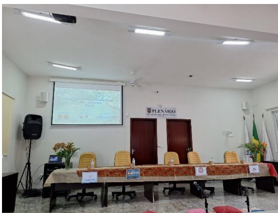
Organização da bancada para o evento.