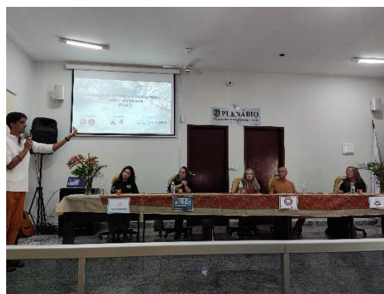
Composição da bancada com o projeto e parceiros. Autoria: Carolina Baumgratz Data: 13/07/2024