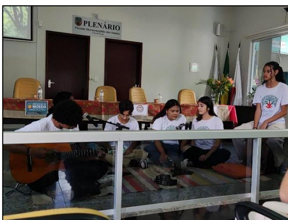
Apresentação musical dos estudantes. Data: 13/07/2024