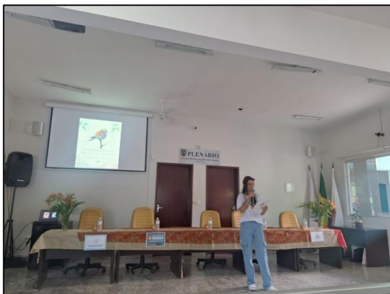
Apresentação de poesias autorais. Autoria: Luísa Mosqueira Data: 13/07/2024

Em seguida, foram realizadas leituras de poesias autorais, escritas por duas participantes. As poesias foram elaboradas pelos jovens, com temáticas sobre questões ambientais e regionais do município de Moeda. A primeira leitura foi de um texto intitulado "Um Pássaro e seu Pedido de Socorro" e o segundo foi "A Serra e sua Moeda".