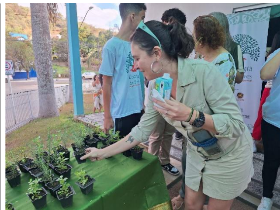
Lanche e doação de mudas no final do evento.