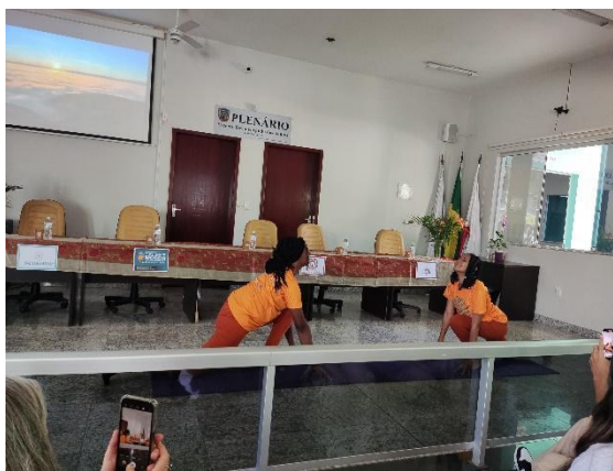
Apresentação de "Saudação ao Sol". Autoria: Carolina Baumgratz Data: 13/07/2024

Em seguida, foram realizadas leituras de poesias autorais, escritas por duas participantes. As poesias foram elaboradas pelos jovens, com temáticas sobre questões ambientais e regionais do município de Moeda. A primeira leitura foi de um texto intitulado "Um Pássaro e seu Pedido de Socorro" e o segundo foi "A Serra e sua Moeda".