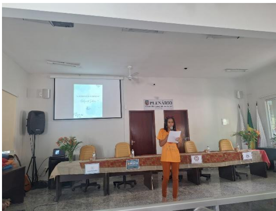
Apresentação de poesias autorais. Autoria: Luísa Mosqueira Data: 13/07/2024

Com as apresentações artísticas realizadas, ainda por meio dos estudantes, foi feita uma apresentação do trabalho desenvolvido pelos jovens na Casa do Guru e com a comunidade de Moeda. A apresentação trouxe uma síntese dos resultados obtidos em 2021 e 2022 e as ações executadas em 2023, pela Plataforma Semente. Dentre as ações, o artigo "Ecologia de Saberes: diálogos entre a Casa do Guru e o