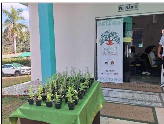
Entrada da Câmara Municipal de Moeda.